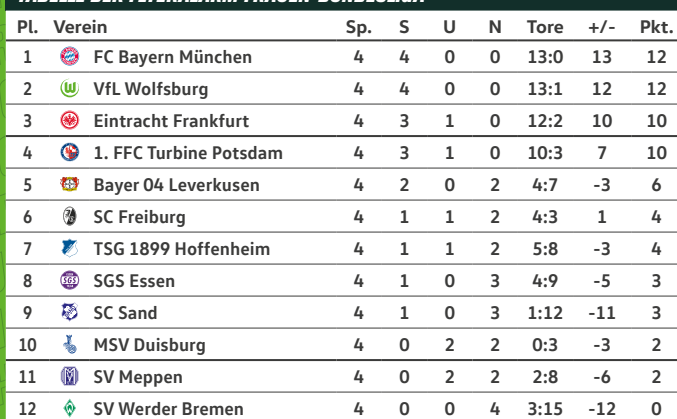
TABELLE DER FLYERALARM FRAUEN-BUNDESLIGA*