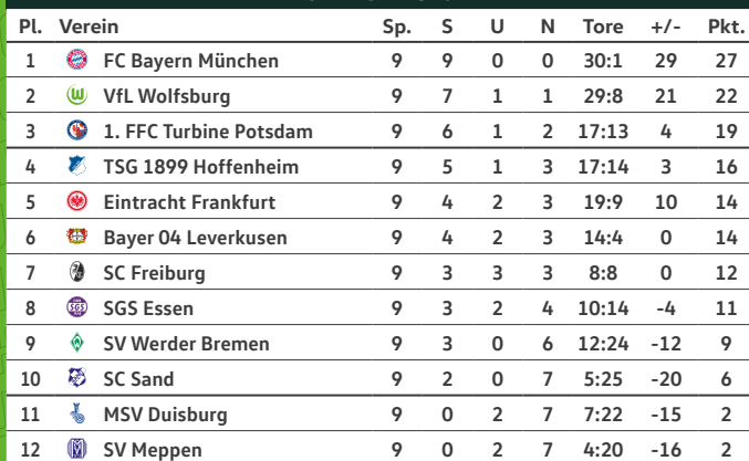
TABELLE DER FLYERALARM FRAUEN-BUNDESLIGA*